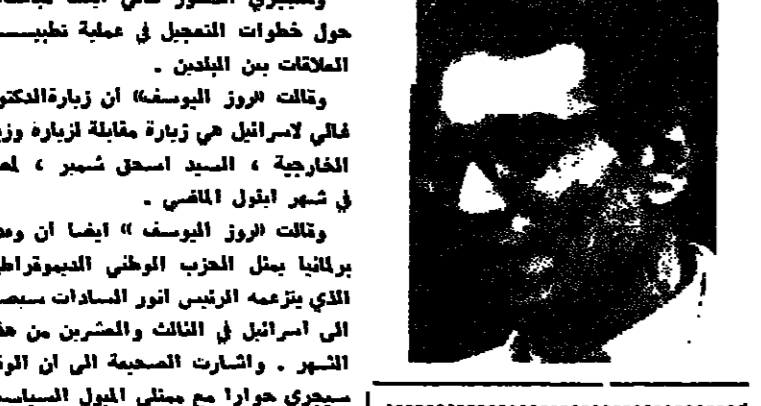
القاهرة - اعدت أمس جولة (روز اليوسف) المصرية ان الدكتور بطرس غالي ، وزير الدولة المصري للشؤون الخارجية سيزور اسرائيل في الاسبوع القادم استعداداً لاستئناف المفاوضات حول الحكم الاداري الذاتي . ومن المقرر ان تستأنف المفاوضات في ١٧ نوفمبر الجاري . وسيجري الدكتور غالي ايضا مباحثات حول خطوات التعجيل في عملية تطبيع العلاقات بين البلدين . وقالت (روز اليوسف) ان زيارة الدكتور غالي لاسرائيل هي زيارة مقابلة لزيارة وزير الخارجية ، السيد اسحق شيمرون ، لمر في شهر ايلول الماضي . وقالت (روز اليوسف) ايضا ان زيارته لبرلينا يمثل الحزب الوطني الديمقراطي الذي يترجمه الرئيس انور السادات من هذا الى اسرائيل في الثالث والخميس من هذا الشهر . وأشارت الصحيفة الى ان الوفد سيجري حوارا مع ممثلي الجبهة الشعبية المقاتلة في اسرائيل بما فيها احزاب ، اسئلة جامعات ، ابناء «وحركة السلام

غالي يزور اسرائيل في الاسبوع القادم لبحث استئناف مفاوضات الحكم الذاتي وخطوات التعجيل في عملية تطبيع العلاقات القاهرة - اعدت أمس جولة (روز اليوسف) المصرية ان الدكتور بطرس غالي ، وزير الدولة المصري للشؤون الخارجية سيزور اسرائيل في الاسبوع القادم استعداداً لاستئناف المفاوضات حول الحكم الاداري الذاتي . ومن المقرر ان تستأنف المفاوضات في ١٧ نوفمبر الجاري . وسيجري الدكتور غالي ايضا مباحثات حول خطوات التعجيل في عملية تطبيع العلاقات بين البلدين . وقالت (روز اليوسف) ان زيارة الدكتور غالي لاسرائيل هي زيارة مقابلة لزيارة وزير الخارجية ، السيد اسحق شيمرون ، لمر في شهر ايلول الماضي . وقالت (روز اليوسف) ايضا ان زيارته لبرلينا يمثل الحزب الوطني الديمقراطي الذي يترجمه الرئيس انور السادات من هذا الى اسرائيل في الثالث والخميس من هذا الشهر . وأشارت الصحيفة الى ان الوفد سيجري حوارا مع ممثلي الجبهة الشعبية المقاتلة في اسرائيل بما فيها احزاب ، اسئلة جامعات ، ابناء «وحركة السلام